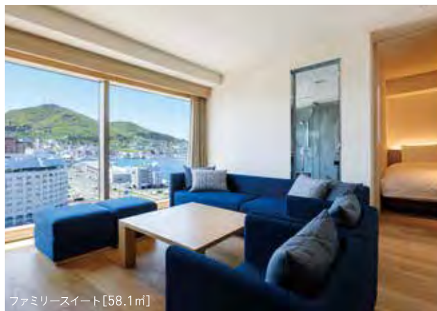
ファミリースイート [58.1㎡]