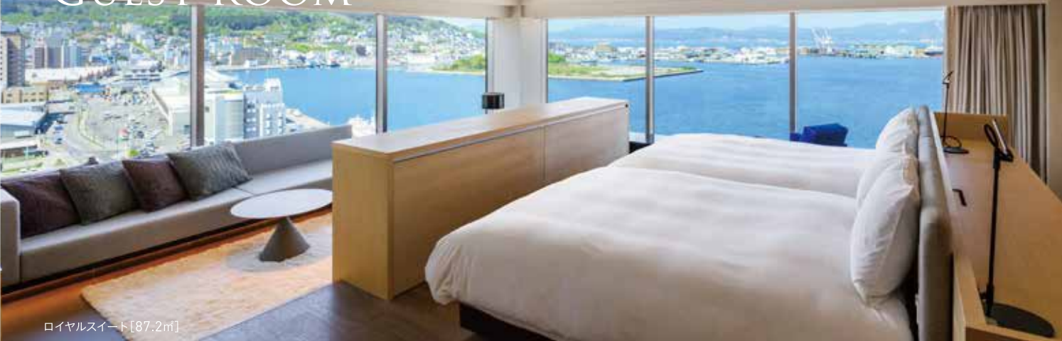
ロイヤルスイート [87.2㎡]