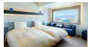
ツイン [24.0㎡] Twin Room