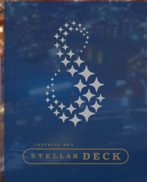
天空露天風呂 インフィニティ スパ ステラデッキ