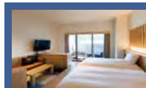
デラックスドッグラバーズ [46.0㎡] Deluxe Dog Lovers