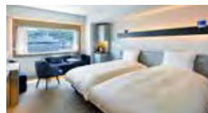
デラックスツイン [30.4㎡] Deluxe Twin Room