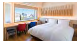
プレミアクイーン [22.4㎡] Premier Queen Room