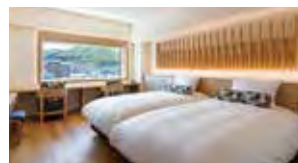
プレミアデラックスツイン [30.4㎡] Premier Deluxe Twin Room

There are 17 types of guest rooms in total. We have rooms available to suit the preference of all our customers.